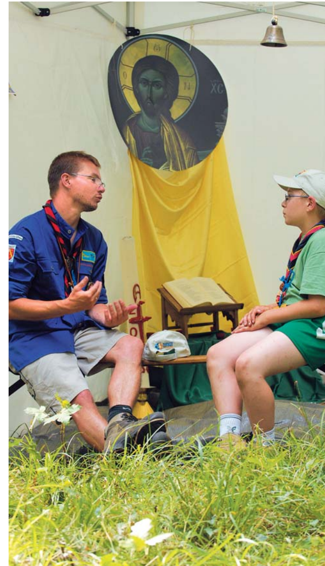
Jamboree scouts-guides "Quels talents !", été 2006, Jambville

Lorsque l'on se rend chez quelqu'un on entre par une porte, celle de l'amitié, celle du service attendu ou donné, celle de la table partagée, celle du dialogue. « Voici que je me tiens à la porte, et je frappe. Si quelqu'un entend ma voix et ouvre la porte, j'entrerai chez lui ; je prendrai mon repas avec lui et lui avec moi. » Livre de l'Apocalypse 3/20